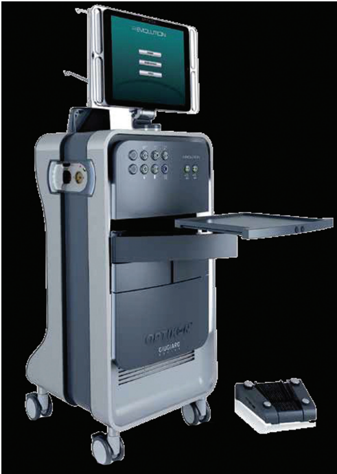
Resim 4: VSY R-Evolution CR vitrektomi cihazı ve kablo-suz ayak pedalı görülmektedir.

Sahip olduğu pnömatik sistemle çalışan kesicisi dakikada 6000 kesi hızına ulaşabilmektedir. Ayrıca 23 G ve 25 G ile kullanıma izin veren ve ikiz görev döngüsüne benzer bir sistemle çalışarak hem kapanma hem açılma aşamalarında kesim yapabilen twedge probu mevcuttur. 39 Ayrıca yüksek myopik gözlerin vitreoretinal cerrahisi için geliştirilen 34 mm uzunluğunda kesiciye sahiptir. 38 Cihazda ayrıca yüksek, orta ve alçak seçenekleri mümkün olan görev döngüsü alternatifleri mevcuttur. Düşük kesim hızlarında; yüksek görev döngüsü seçeneğinde vitreus akım hızı maksimumken; kesi hızı arttıkça tüm görev döngüsü seçeneklerinde akım hızında azalma izlenmekte ve kesi hızı 5000-6000/dk aralığında iken tüm görev döngüsü seçenekleri ile sabit ve eşit bir vitreus akım hızı elde edilmektedir. 39