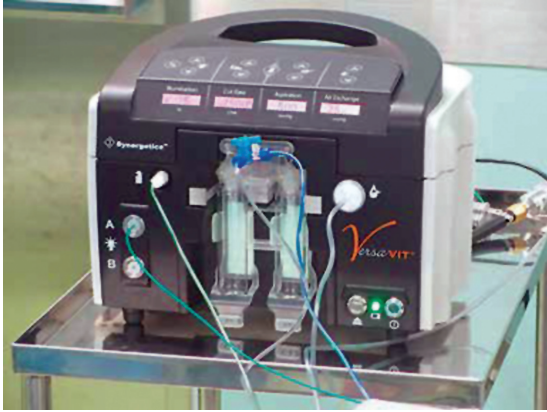
Resim 5: Synergetics VersaVit 2.0 vitrektomi cihazı görülmektedir.