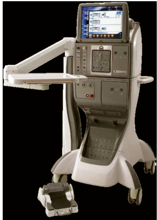
Resim 1: Alcon Constellation vitrektomi cihazı ve kablosuz ayak pedalı görülmektedir.

Ozil teknolojisinin eşsiz hareket tarzı ile daha az ultrason gücü kullanılarak güvenli bir termal güçle lens parçaları emülsifiye edilebilmektedir. 30 Cihazda ayrıca sadece 20 G ile kullanıma izin veren ayrı bir fakofragmentasyon elciği bulunmaktadır. Constellation sistemi oldukça iyi bir aydınlatma sağlayan xenon ışık kaynağını kullanmaktadır; ancak tek tip ışık filtresi içermektedir. Cihazın bazı dezavantajları da bulunmaktadır. Özellikle kullanıcılar tarafından belirtilen cerrahi sırasında infüzyon kanülünde oluşan hava baloncukları ve bazen görülebilen nedeni bilinmeyen kontrolsüz reflü problemlerinin çözülmesiyle ilgili araştırmalar devam etmektedir. 31 Cihazda farklı tipte xenon filtrelerinin bulunmaması, tek tip fakofragmentoma zorunlu olunması ve benzerlerine göre daha yüksek maliyet diğer sınırlamalar olarak sayılabilir.