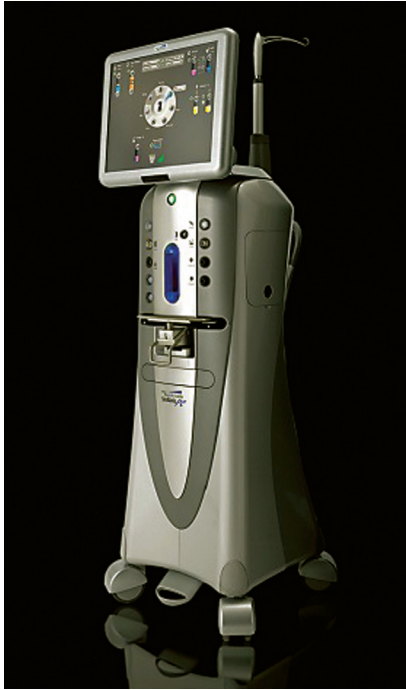
Resim 3: Bausch&Lomb Stellaris PC vitrektomi cihazı görülmektedir.

2010 yılında piyasaya sürülen Amerika kökenli firmanın ürettiği Bausch&Lomb Stellaris PC (Procedure Choice) sistemi de üzerinde yapılan geliştirmelerle piyasadaki çok özellikli ve entegre cihazlardan biri haline gelmiştir (Resim 3). Cihaz 20 G, 23 G ve 25 G kalınlıklarda trokar kanül sistemleri ile kullanılabilir, 27 G henüz mevcut değildir. 35 Burada cihazdaki en önemli avantajlardan biri olarak açık mimari sistemini vurgulamak gerekir. Bu sistem sayesinde Stellaris PC vitrektomi cihazı diğer firmalar tarafından üretilen bazı enstrümanlar ile birlikte kullanılabilir. Stellaris PC sistemi, Bausch&Lomb'un bir önceki vitrektomi cihazı olan Millenium sisteminde olduğu gibi ventüri pompa kaynaklı bir sistem kullanıyor olsa da sahip olduğu özel bir kapakçık sistemi (pinch valve) ile önceki sistemde görülebilen pasif aspirasyon gibi problemler çözülmüştür. Stellaris PC sisteminin bir diğer önemli avantajı da eşsiz kanülleri ve titanyum trokarlarıdır. Gelişmiş yara yönetimi (Advanced Wound Management) sistemi sayesinde trokardaki daha uzun keskin uç ile sklerotomi sırasında tünel insizyon yaparken daha sığ açılı girişi imkânı sunmaktadır. Ayrıca isteğe bağlı sökülebilir takılabilir valvli kanüller cihazın diğer bir ergonomik özelliğidir. 35 Cihazda tüm kesi hızlarında port açıklığı %50'nin altına inmeyen, dakikada 5000 kesi yapabilen pnömatik sistemli kesici ile ventüri pompanın güvenliliği artırılmıştır.