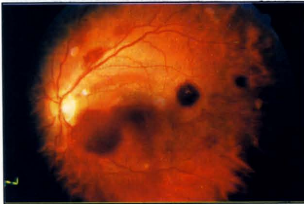
Şekil 6. ALL'li bir hastamızın renkli fundus fotoğrafında retinal hemorajiler + cotton-wool spot+beyaz merkezli hemoraji.

beyaz merkezli hemoraji, 1' inde retinal hemoraji + CW spot + beyaz merkezli hemoraji (Şekil 6), 4' ünde papilödem, 1' inde lakrimal gland infiltrasyonu saptanmıştır.