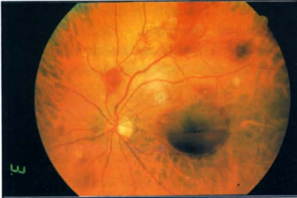
Şekil 1. ANLL'li bir hastamızın renkli fundus fotoğrafında retinal hemorajiler.

Oküler tutulumu olan ANLL' li hastaların 11' inde retinal hemorajiler (Şekil 1), 5' inde retinal hemoraji + CW spot, 6' sında retinal hemoraji + beyaz merkezli hemoraji (Şekil 2),