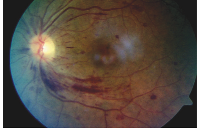
Resim 2: Sol gözde iç şeklide ve yuvarlak intraretinal hemorajiler ve artmış venöz kıvrım.

rin kullanımı olmayan hastalarda da retinopati gelişimini gösteren çalışmalar bulunmaktadır. Radyasyona bağlı gelişen retinopati ise ilerleyici özelliktedir ve iriste, optik diskte ve retinada neovaskülarizasyon ve vitreus hemorajisi gelişimine neden olabilmektedir. Transplantasyon sonrası gelişen retinopati ise genellikle normale dönmektedir. Ayrıca, radyasyon tedavisi almayan hastalarda da retinopati gelişimi bildirilmiştir. 5,6,8,9 Hastamızda da PKHT'dan 6 ay önce boyun bölgesine lokalize radyasyon alma hikayesi bulunmaktaydı ve radyasyon kullanımının retinopati gelişiminde tek başına sorumlu olamayacağı, ancak katkıda bulunan faktörler arasında yer alabileceği söylenebilir.